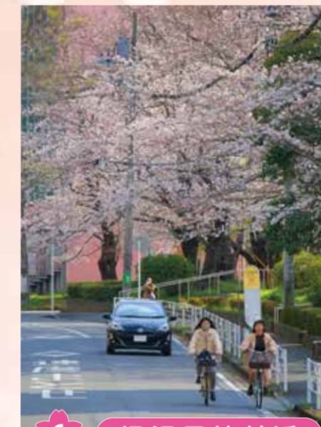
6 汲沢団地付近 バス停「汲沢中央」を降りると桜並木が広がっています。バスに乗車しながら桜のトンネルをくぐることもできるのも醍醐味です。