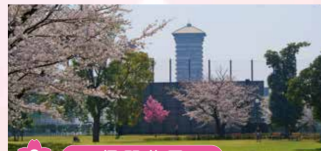
8 侯野公園 野球場や芝生広場、遊具広場などがある広い公園。公園では、ドリームランド時代の桜を受け継ぎ、保全に取り組んでいます。剪定枝などから作った堆肥と金沢動物園のゾウの糞で発酵させた堆肥を配合して土を改良し、桜を元気にしています。