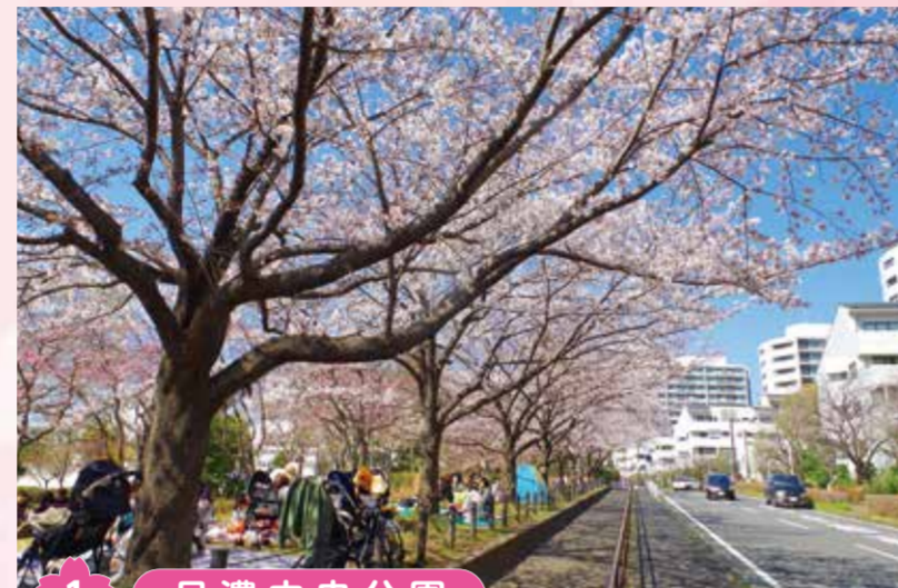
1 品濃中央公園 東戸塚駅から近く、広々とした公園。桜の下で小さなお子さんと一緒に楽しく花見をする人たちにぎわいます。

東侯野町80-1 ☎852-8038 ☎852-8048 外苑・内苑庭園部分 9時～17時(7・8月は18時30分まで) 侯野別邸 9時30分～16時30分(7・8月は18時まで) 第3木曜(祝日の場合翌日)、年末年始(12月29日～1月3日) アクセス: 戸塚バスセンター(1番のりば) → [戸81] 藤沢駅北口行 → [鉄砲宿] 下車徒歩5分 駐車場: 37台(30分ごとに100円) 入館料: 本邸(侯野別邸)のみ有料 ※侯野別邸の主屋内以外の園内は無料 中学生以上: 400円、65歳以上・10人以上の団体: 350円