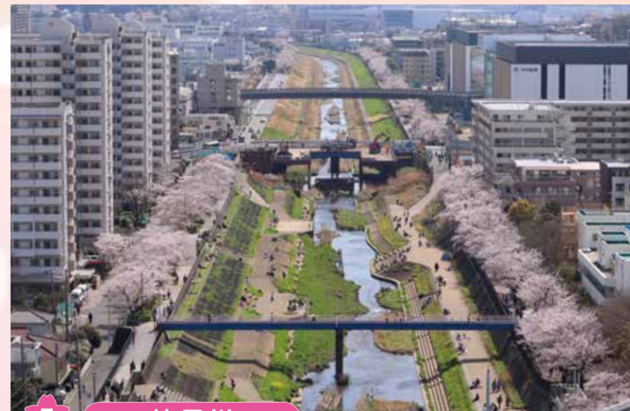
5 柏尾川 柏尾川の桜の歴史は古く、江戸時代からの桜の名所です。現在、区内の柏尾川プロムナードに現存する桜は約700本で、その約8割がソメイヨシノです。そのほかには、オオシマザクラ、ヤマザクラなど9品種が確認されています。