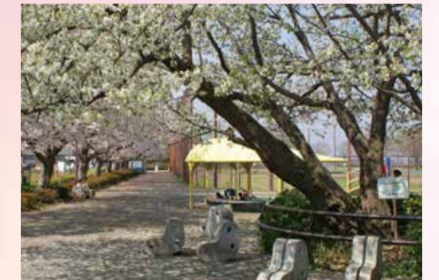
9 東侯野中央公園 イギリスの民話「ジャックと豆の木」をイメージして作られた公園。かつて「横浜ドリームランド」にあった「ホテルエンパイア(現・横浜薬科大学図書館棟)」と桜の風景を望むことができます。