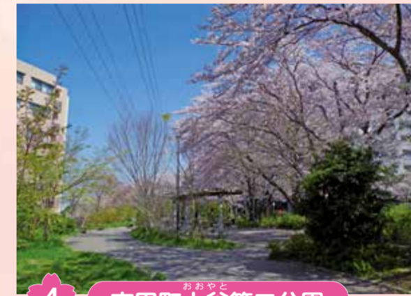
4 吉田町大谷第二公園 公園全体が桜に覆われます。遊歩道も整備されているので小さなお子さんが一緒でも、安心して桜を満喫することができます。