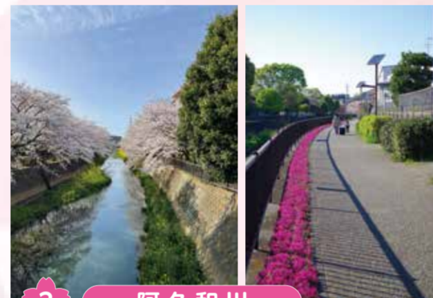
3 阿久和川 両岸から川面に向かって咲き誇る桜と川岸の菜の花と一緒に楽しめます。整備されたプロムナードには、かわいいピンク色の芝桜が彩りを添えています。