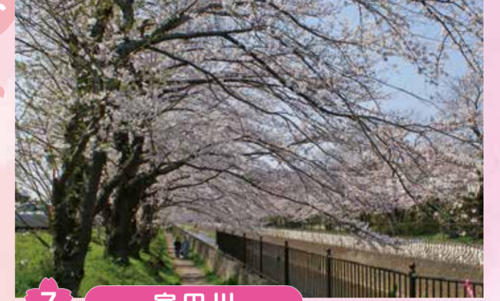
7 宇田川 川の両岸に桜が咲き誇ります。プロムナードの桜のトンネルをゆっくりお散歩しながら桜を楽しめます。