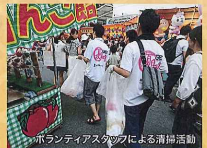
ボランティアスタッフによる清掃活動