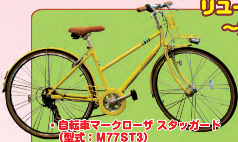
・自転車マークローザ スタッガード (型式: M77ST3)