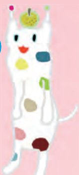
戸塚区のマスコット ウナシー