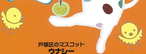
戸塚区のマスコット ウナシー